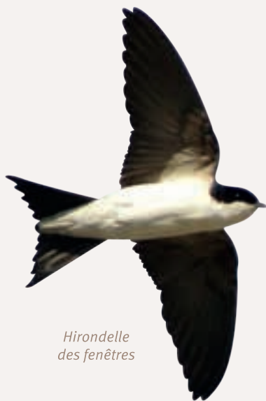
Hirondelle des fenêtres

Les hirondelles sont les messagères du printemps et leur présence près de nos habitations porterait bonheur... La plupart des gens des campagnes respectent d'ailleurs les nids, parfois même ceux installés dans la chambre à coucher (cas de l'Hirondelle rustique) !