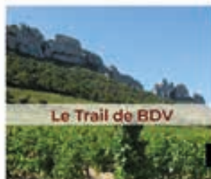
Le Trail de BDV

23 km et 950 m de dénivelé. En autonomie totale. Départ 9h.