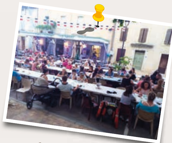
Loto des commerçants