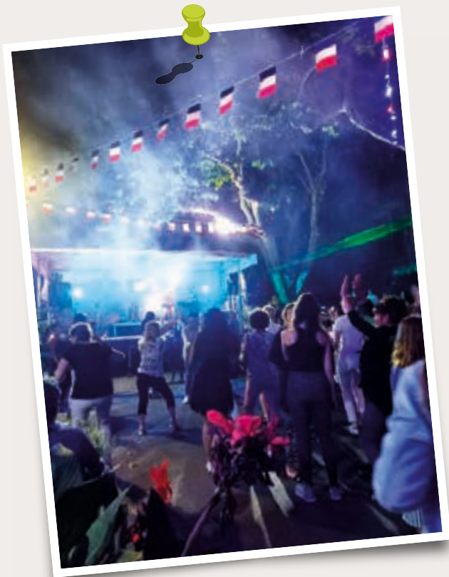
Fête du 13 juillet