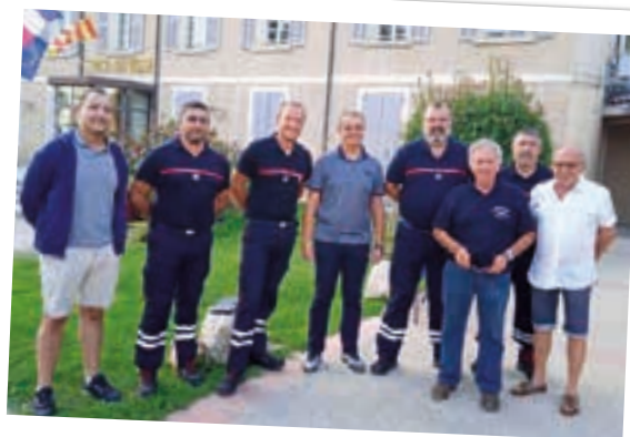
Apéritif avec les pompiers