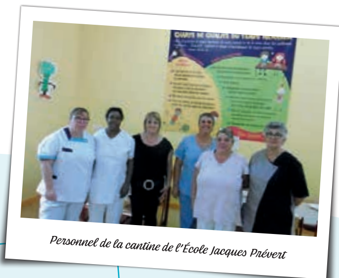
Personnel de la cantine de l'École Jacques Prévert

Face à la forte augmentation des prix des matières premières et de l'application de la loi Egalim qui pèsent dans le coût d'élaboration des repas de la cantine, la municipalité a fait le choix dans un premier temps de ne pas répercuter cette hausse sur le prix du repas afin de ne pas le faire peser sur les familles balméennes.