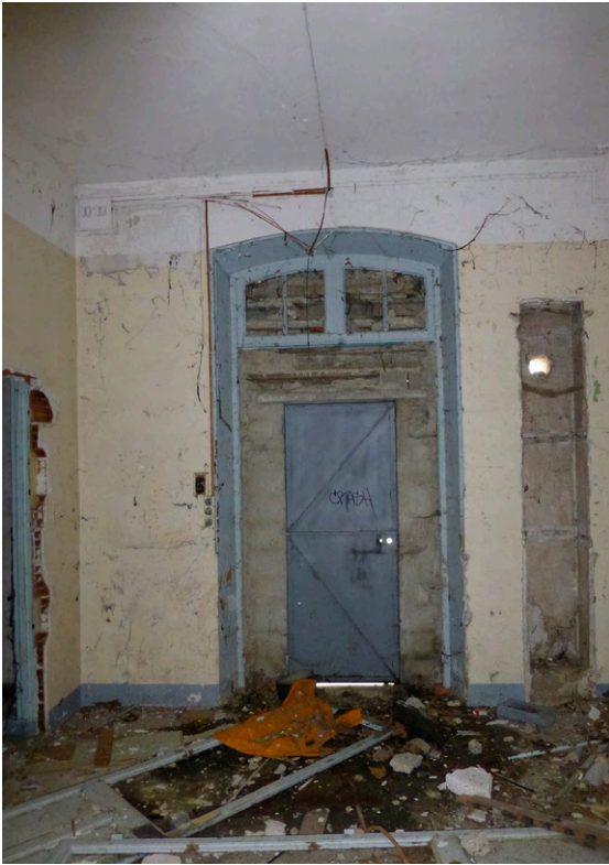
11. Bureau du chef de gare