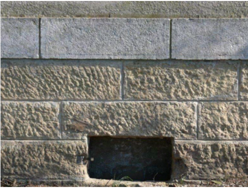
3. Ceinture de pierre calcaire surmontant les plinthes