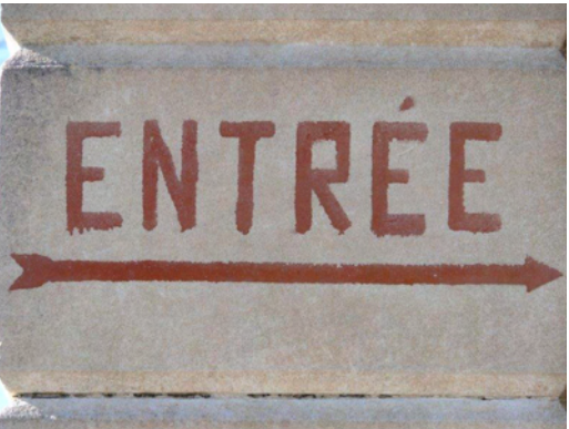
9. Inscription peinte indiquant l'entrée du bâtiment