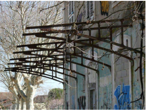
5. Marquise dont ne subsiste que 8 consoles de fer