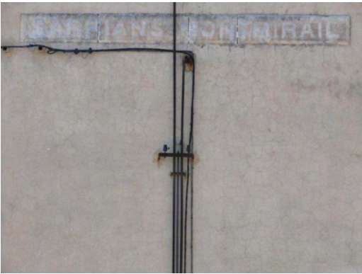
6. Inscription Sarrians-Montmirail en blanc sur fon bleu