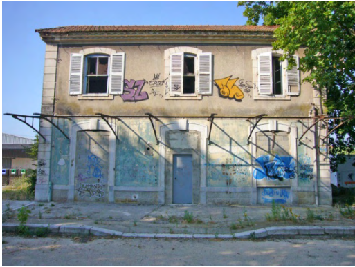
2. Façade nord du bâtiment principal