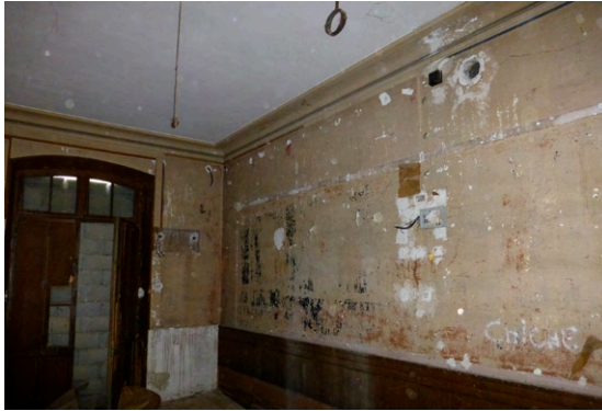
14. Salle d'attente