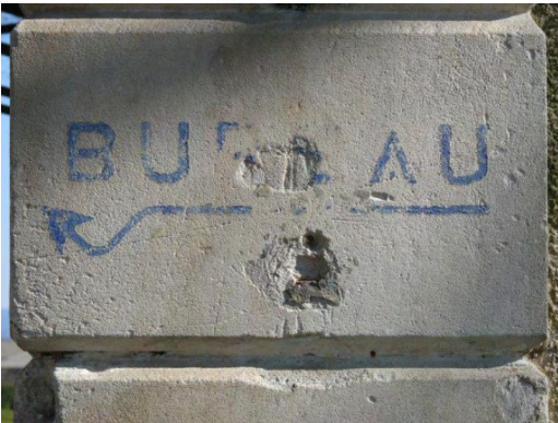
10. Inscription peinte indiquant le bureau de la gare