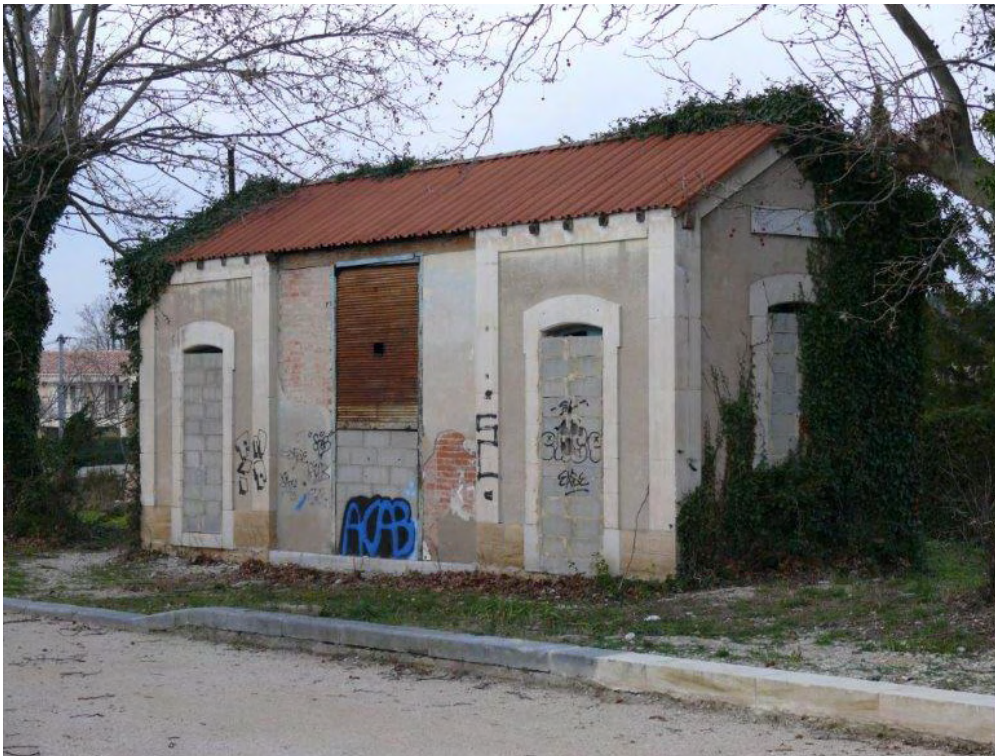
18. Bâtiment annexe

La cave est accessible par un petit escalier maçonné attenant à l'escalier principal. La voûte en arc surbaissé repose sur des murs bâtis en maçonnerie irrégulière de type opus incertum. Une trappe vers l'extérieur permet le déchargement.