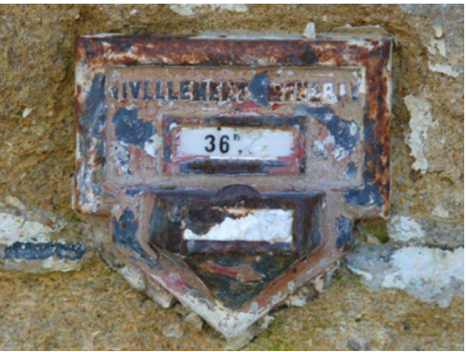
7. Repère altimétrique du nivellement général