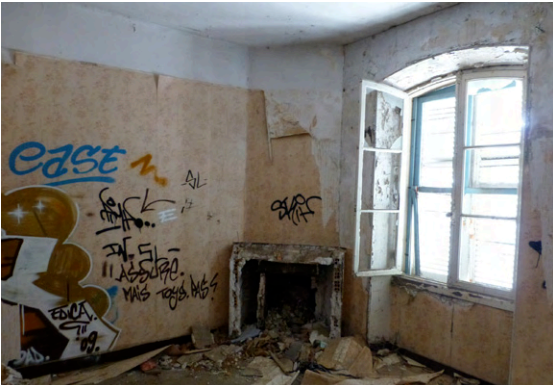
15. Chambre à l'étage