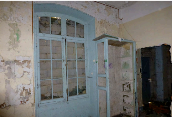
13. Salle des pas-perdus