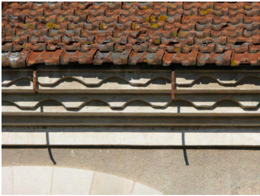
4. Corniche à frise inspirée de la génoise à deux rangs