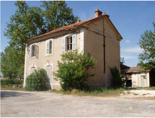
1. Façade sud du bâtiment principal